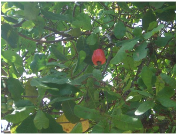
Cajueiro da EBC