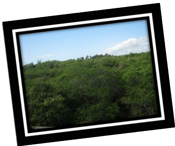
Imagem do Manguezal

Médio. Com a ajuda dos nossos irmãos canadenses e a luta do nosso dia-a-dia de todos que fazem esta Instituição. Se você irá cursar o 1º ano do Médio corra e matricule-se, pois a família EBC está te esperando para que você seja mais um integrante dela e receba acima de tudo a ciência da vida, que é a Palavra de Deus! Além de salas confortáveis ainda Deus tem nos agraciado com uma linda visão natural de um manguezal, confira.