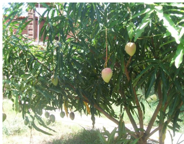
Mangueira (manga rosa) rosa da EBC

Nesta época, nossas mangueiras e cajueiros estão carregados. E uma vez ou outra podemos saborear desses frutos.