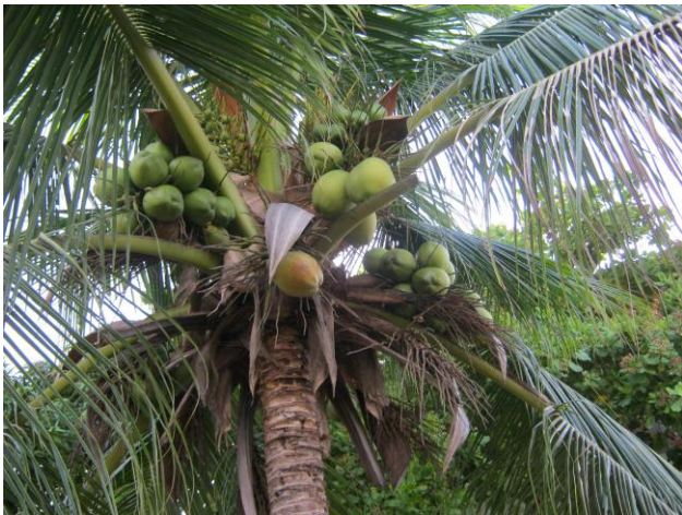
Coqueiro da EBC