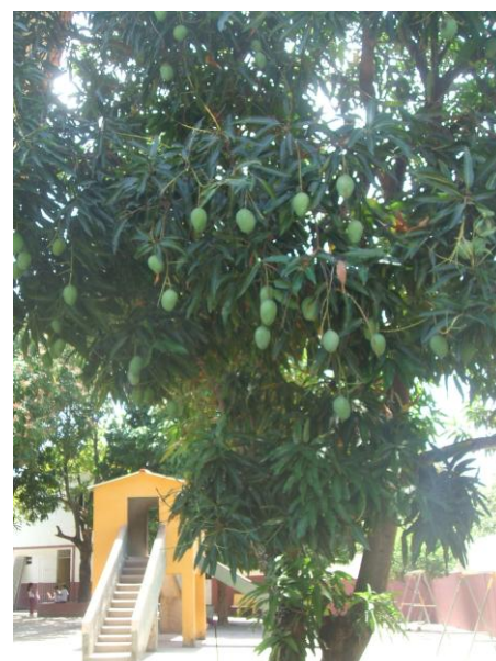
Mangueira manga espada da EBC